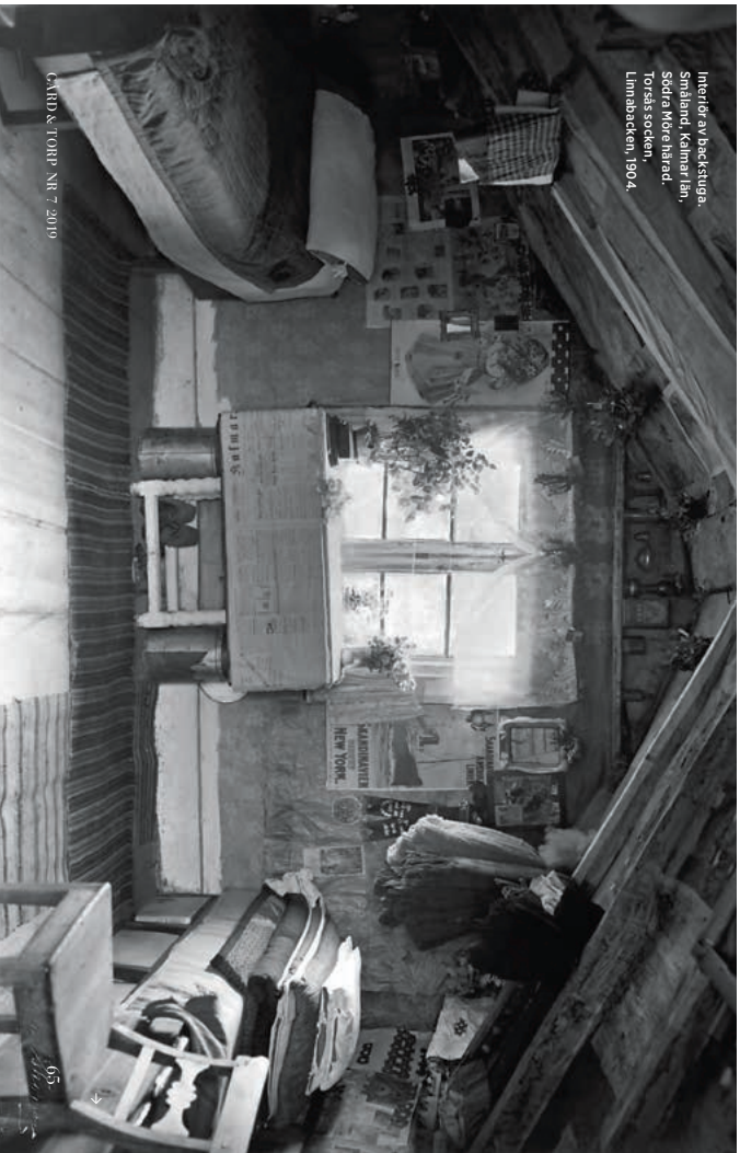
Interiör av backstuga, Småland, Karlmarin, Södra Möre härad, Torås socken, Linnabacken, 1904.